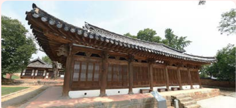
김제동헌(시도유형문화재 제60호) 옛 고을 수령의 집무공간으로 현재는 백성에 더 가까이 다가간다는 뜻으로 근민헌이라는 현판이 걸려있다. 김제시 동헌4길 46-1(교동)