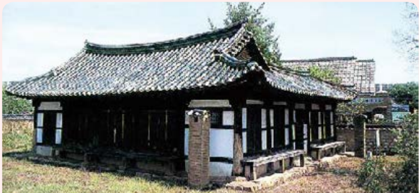
김제내야(시도유형문화재 제61호) 김제내야는 서헌이라고도 불리며 고을 수령의 살림집이라 할 수 있는 관사의 기능을 하였다. 김제시 동헌4길 46-1(교동)

김제시는 지난 7월 16일 고용노동부 사업중 역대 최대 규모의 공모 사업인 고용안정 선제대응 패키지 지원사업의 컨트롤타워 역할을 할 ‘김제 고용안정 일자리센터(이하 김제 일자리센터)’ 개소식을 갖고 본격적인 활동에 돌입했다. 올해부터 향후 5년간 300억 원을 투입해 자동차 부품 등 위기에 빠진 주력산업을 활성화하고, 최근 성장세를 보이고 있는 농식품산업과 미래형 특장차 등 신산업을 육성해 더 좋은 일자리, 새로운 일자리 3,000개를 창출한다는 방침이다. 검산동(금성로 145, 2층)에 둥지를 튼 ‘김제 일자리센터’는 기업지원팀과 취업연계팀, 사업지원팀 등 3개 팀 12명의 인력으로 조직이 구성되었으며, 기업지원팀은 중앙부처 및 전라북도와 각 지자체 등을 연계하여 기업유치 활동을 비롯 기업컨설팅 등을 수행하며, 취업연계팀은 채용기업과 구직자를 연계하는 고용서비스 제공 및 일자리 발굴단 등을 관리·운영하고, 사업지원팀은 기업지원팀과 취업연계팀을 지원하며 일부 세부사업을 수행하는 역할을 담당하게 된다. ‘김제 일자리센터’는 지역산업과 고용을 연계하는 새로운 김제시 고용정책의 중심적 역할을 담당할 기구로서 다양한 기업 혜택과 고용서비스를 지원하고, 시민 눈높이에 맞는 일자리를 제공하여 지역경제에 활력과 생기를 불어넣을 것으로 큰 기대를 모으고 있다.