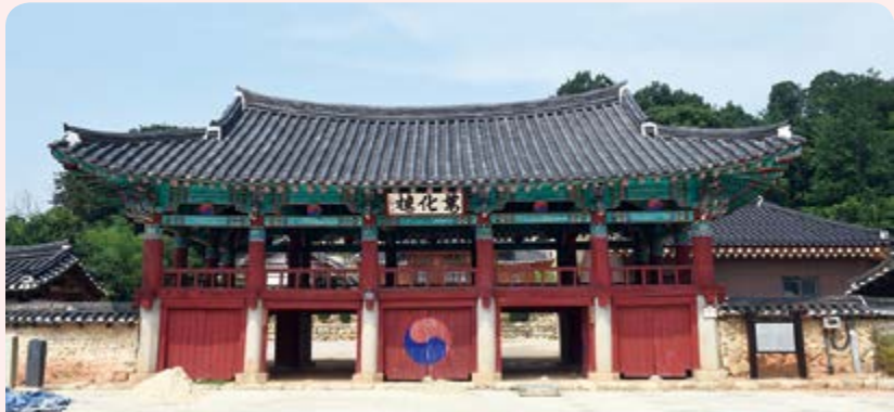
김제향교(사적 제480호) 김제향교는 조선시대 중등 국립교육기관으로 교육과 공자에 대한 제사의 기능을 동시에 수행하던 기관이었다. 김제시 향교길89-3(교동)