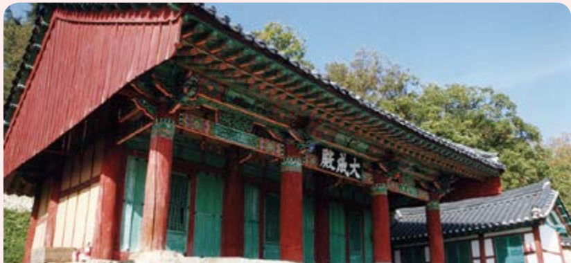
김제향교 대성전(시도유형문화재 제9호) 김제향교 맨 뒤쪽에 위치한 건물로 공자에 대한 제사의 기능을 하던 건물이다.