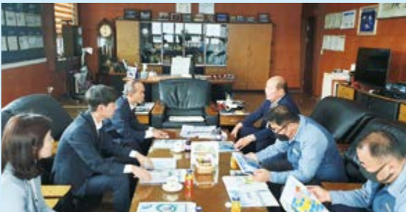
경북 경주 소재 기업유치 활동 전개