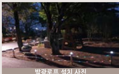
발광로프 설치 사진