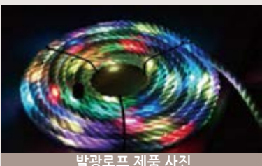
발광로프 제품 사진