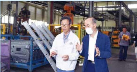
월촌농공단지내 삼진산업 현장 방문