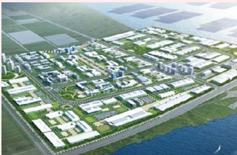
새만금 국제협력용지 복합단지

민선7기 후반기, 포스트 코로나 시대의 지역경제 도약을 준비하기 위해 김제만의 새로운 성장엔진을 장착해간다. 무한한 성장잠재력을 품은 새만금에 조성될 새만금 국제협력용지 복합단지(75만 평규모)는, 첨단지식 산업이 집약된 미래경제의 핵심축으로 발전시켜 전북권 산업발전의 메카로 만들어간다. 전국 유일의 백구특장차 전문단지는 제2, 제3의 단지로 확대 조성해, 국내 최대 특장차 클러스터로 발전시켜 명실공히 대한민국 특장차 산업의 중심지로 조성해간다. 또한 전국 1위로 선정된 고용안정 선제대응 패키지 사업으로 5년간 300억원을 투입해 일자리 창출 플랫폼을 구축하는 등 후반기 2년 주력산업의 혁신성장을 견인하고, 신산업을 발굴·육성해 나갈 계획이다. 아울러, 지평선산업단지 공동주택(510세대 규모) 분양, 도시재생 뉴딜사업(요촌동, 성산지구, 신풍지구), 김제사랑 상품권 이용 활성화, 소상공인 경영안전망 강화 등을 통해 김제의 신 경제도약 시대를 열어갈 것이다.