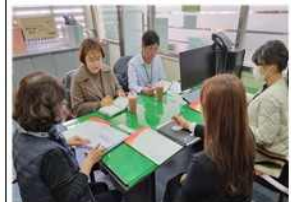
민간협력 네트워크 간담회