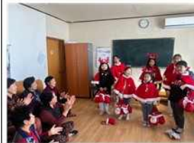
1·3세대 동량초등학교(우리마을 어린이산다)