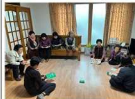
주민간담회 및 사업안내