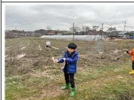
1·3세대 동량초등학교(경로대보문 저널라이프)