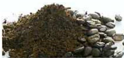
커피, 한약 찌꺼기