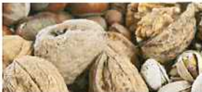
단단한 견과류 껍질