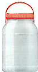
플라스틱 담금주 용기