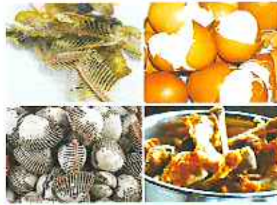
계란, 조개껍데기, 동물뼈 등