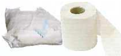
재활용이 안되는 폐지류