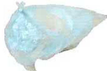
이물질이 묻은 비닐 등 (그 밖에 재활용 불가 자연성 폐기물)