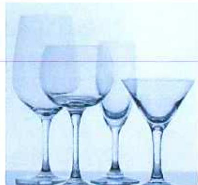
내열식기류 (내열유리용기, 내열유리냄비, 유리뚜껑 등)