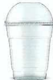
일회용 플라스틱 컵