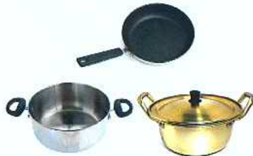
비철금속(알루미늄, 스텐 등)