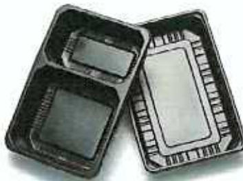
플라스틱 배달 용기