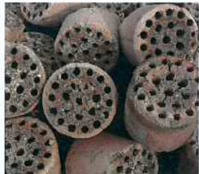
연탄재, 토사류, 석재, 회분류 등