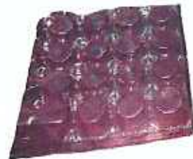
플라스틱 재질 계란 용기