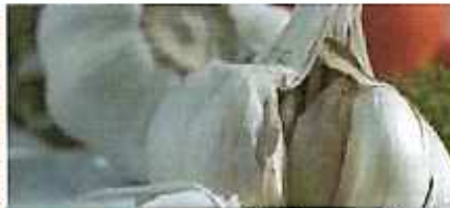
ceboll · 마늘 · 파인애플 껍질