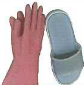
고무장갑, 슬리퍼, 찻솔 등 (다른 재질과 혼합되어 재활용이 어려운 물품)