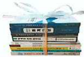
책자, 노트류 종이쇼핑백, 달력, 포장지