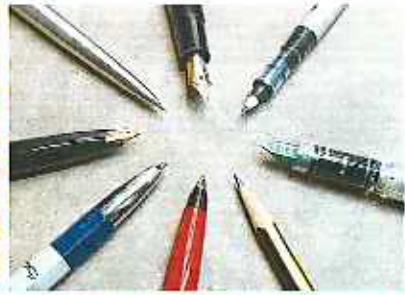
샤프, 볼펜 등 필기구류