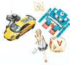
소형 장난감류 (30cmX30cm 범위 내)