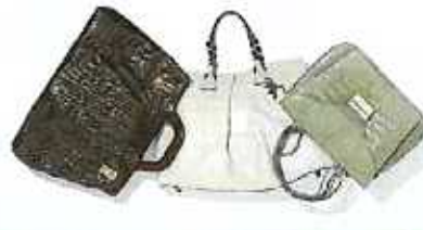
가방 (여행가방, 골프가방은 대량폐기물)