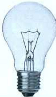
전등류 (백열전구, LED전구, 깨진 폐형광등) ※ 깨지지 않은 폐형광등은 제외