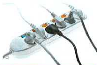
전선류 (가정에서 발생하는 소량에 한함)