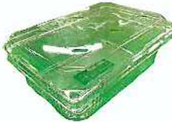
플라스틱 과일 포장 용기