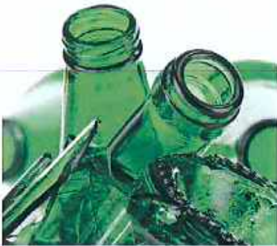
유리류 (꽃병, 깨진 유리, 크리스탈 유리제품, 거울 등)