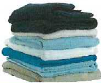
소형 이불류 (가연성 봉투 사용범위 내)