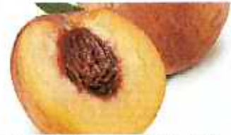
복숭아, 감 등의 단단한 씨