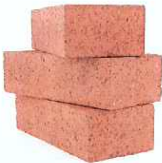
폐재류 (콘크리트, 벽돌, 타일 등) ※ 공사장 생활폐기물은 폐기물처리업체에 위탁처리