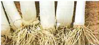
양파 · 파뿌리