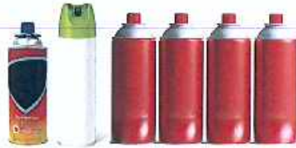
부탄가스, 살충제 용기