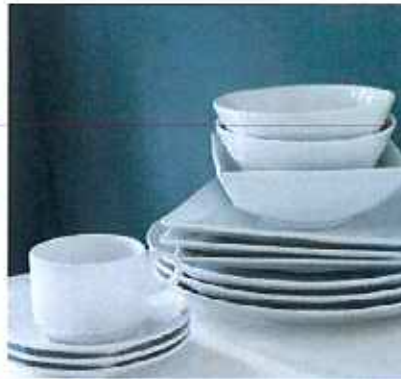
도자기류 (사기그릇, 시기화분 등)