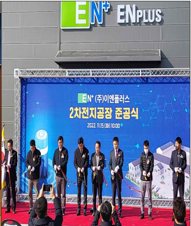
자유무역지역 이엔플러스 준공식 ('22.11.15.)