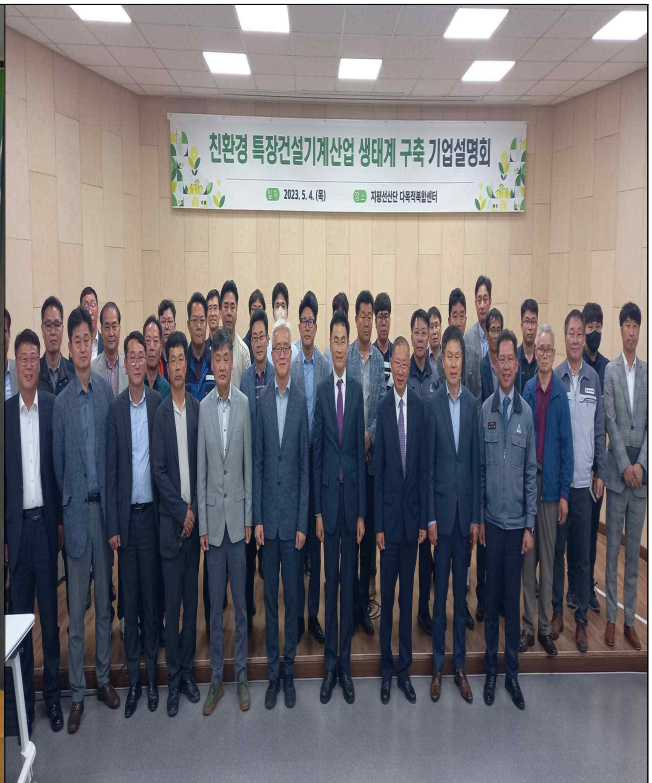
친환경 특장건설기계산업 생태계구축 기업설명회('23.5.4.)