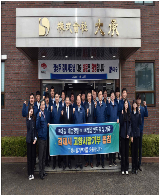
본사방문 (대승, 일강, 대승정밀)('23.3.23.)