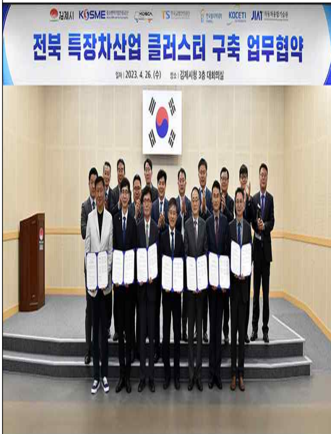
전북 특장차산업 클러스터 구축 업무협약식 ('23.4.26.)