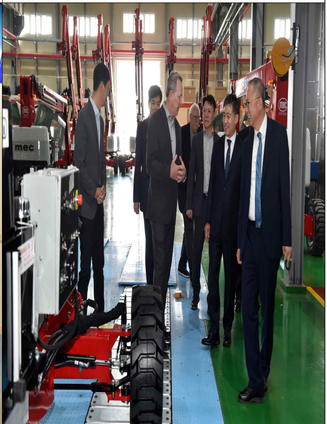
미국 건설기계 기업 MEC대표 김제공장(HR E&I) 방문('23.4.28.)