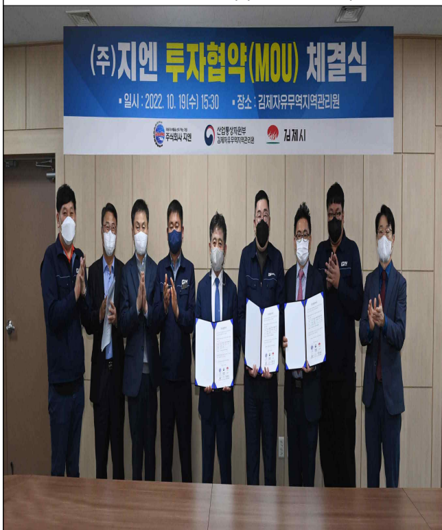
지평선산단(자유무역지역) 투자협약식 (주)지엔('22.10.19.)