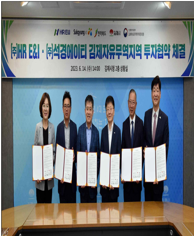
지평선산단(자유무역지역) (주)HR E&I, (주)석경에이티 투자협약식 ('23.6.14.)