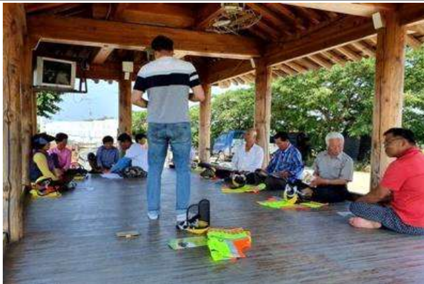
농기계 순회 안전·관리교육 사진