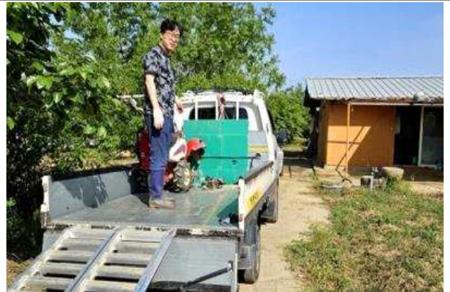
농기계현장 직접배달서비스 사진