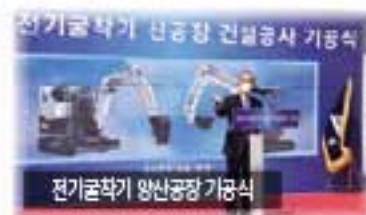
전기굴착기 생산공장 기동식

「청년이 돌아오는 김제, 청년이 살고 싶은 김제」를 만들기 위한 박준배 시장의 의지는 굳건했고 다양한 청년 취·창업정책들이 그 성과를 하나씩 나타나고 있다. 지난 1월 가장한 김제 전통시장 청년몰(아리몰)도 그 일환의 연속이다. 2019년 5월 복합청년몰 조성사업이 공모에 선정되었음에도 사업대상지 변경, 의회 예산 확보의 어려움, 여론층의 반대 등으로 진척이 안되는 상황에서 끝까지 포기하지 않고 설득하여 현재 9명의 청년CEO가 하루하루 꿈을 실현해나가고 있다.