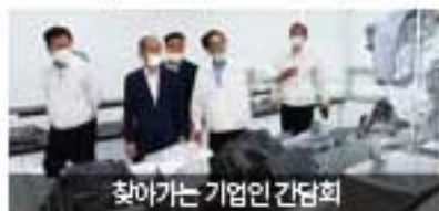
찾아가는 기업인 간담회