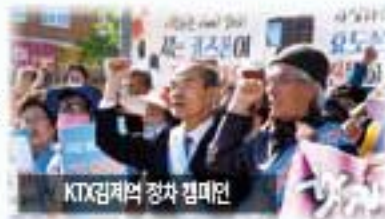
KTX김제역 정차 캠페인

주위에서 5%의 가능성도 없다고 한 'KTX 김제역 정차'를 들 수 있다. 2019년 4월 'KTX김제역 정차 추진위원회' 출범을 시작으로, 7만 6천여 명의 서명과 릴레이 캠페인을 통해 시민들의 염원을 보여줬고, 국회·국토교통부·한국철도공사 등을 끊임없이 찾아가 설득해나갔다. 경제성이 없다는 이유로 절대 불가 입장이던 국토교통부와 한국철도공사를 '서대전을 경유하는 KTX는 나주, 목포, 광주송정역에서 이용하는 고객이 없어, 김제역에 정차하는 것이 오히려 경제적'이라는 논리로 4번의 거절 끝에 꿈쩍하지 않던 국토부를 움직이게 하여 KTX 김제역 정차를 이뤄낸 것이다.