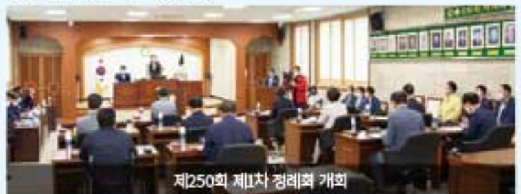
제250회 제1차 정례회 개최

김영자 의장은 15일 개회사에서 지난달 3일 별세한故 노규석 의원의 소식을 전하며, "항상 소동하는 자세와 신뢰로 시민을 위해 헌신했던 고인의 유지를 받들어 김제시의회 모든 의원이 각자의 역할에 최선을 다하자"라고 다짐하였고, 23일 정례회를 마무리하면서 "이번 회기를 기점으로 제8대 후반기 의사 일정의 반환점을 지났다"며, "앞으로도 김제시민의 요구에 충실히 부응할 수 있는 시의회가 될 수 있도록 최선을 다하겠다"라고 밝혔다.