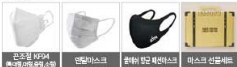
끈조절 KF94 (복대형, 대형, 중형, 소형) 면탈마스크, 쿨마쉬 항균 패션마스크, 마스크 선문세트