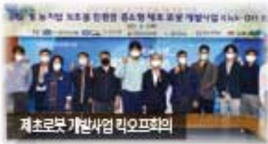
제초로봇 개발사업 리모프회의

사업관철을 위한 자치단체장의 의지와 끈질긴 노력은 '콩 등 발 농작업용 제초로봇'에서도 결과가 나타난다. 중앙부처에 사업이 반영되기까지 '시기적으로 빠르다', '발작물 재배현황이 로봇을 사용하기에는 맞지 않다' 등 부정적인 견해가 지배적이었으나, 국회와 중앙부처를 수차례 방문하여 사업의 당위성을 역설하며 끈질긴 설득과 노력 끝에 국가사업 반영을 관철시켰다. 전국 최대 콩 재배지역인 김제는 친환경 제초로봇 개발의 최적지로 고령화 및 인력부족 문제를 해결하는데 큰 도움을 줄 것이다.