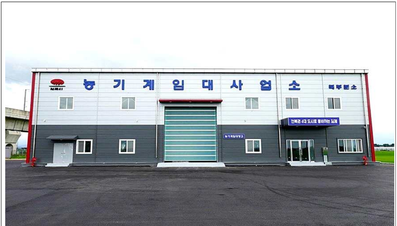
농기계임대사업소 북부분소 신축

(담당부서 : 농촌지원과 팀 : 농업기계팀 담당자 : 조현승 ☎540-4521)