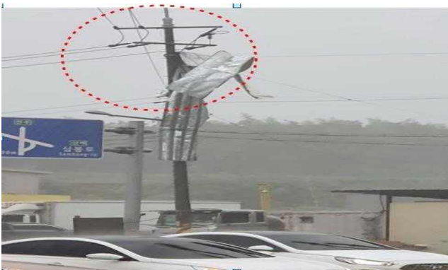
은박비닐이 전선에 접촉 / 정전발생